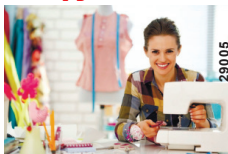
График работы: 5/2. Работа и заработная плата стабильные

Обращаться с 8.00 до 17.00 по тел.: 8-906-504-78-87, 8-966-322-66-22, 8-906-504-77-78 (Telegram, WhatsApp), 8-996-475-56-34