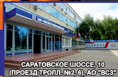
САРАТОВСКОЕ ШОССЕ, 10 (ПРОЕЗД ТРОЛЛ. №2, 6), АО "ВСЗ"