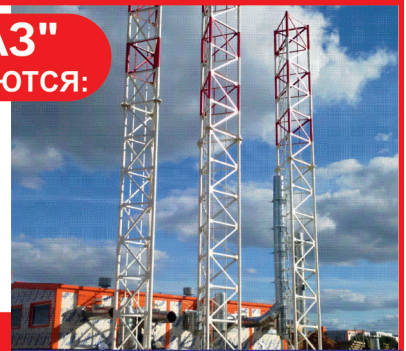
график работы: 5/2 з/п выплачивается без задержек, 2 раза в месяц (аванс + з/п), премия за переработки; официальное трудоустройство; обеспечение спецодеждой; испытательный срок 1 месяц 02004

г. Энгельс, ул. Промышленная, д. 19, ПО «ВИТ-ТЕХГАЗ» Т: 8-927-152-00-04, Ильгам