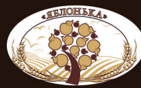
график работы: 5/2, с 8.00 до 17.00 Зав. р-н Т: 8-967-808-04-72