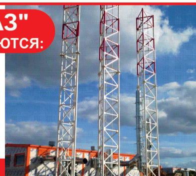
график работы: 5/2 з/п выплачивается без задержек, 2 раза в месяц (аванс + з/п), премия за переработки; официальное трудоустройство; обеспечение спецодеждой; испытательный срок 1 месяц 02014

г. Энгельс, ул. Промышленная, д. 19, ПО «ВИТ-ТЕХГАЗ» Т: 8-927-152-00-04, Ильгам