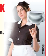
График работы: с 10.00 до 23.00 З/п 2000 руб./смена, питание, развоз бесплатно Т: 68-38-40