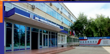
САРАТОВСКОЕ ШОССЕ, 10 (ПРОЕЗД ТРОЛЛ. №2, 6), АО "ВСЗ"

☎ 8(8453) 36-00-63, 8-905-328-76-95. Также ждем Ваши отклики по e-mail: avs@bvsz.ru