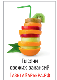
Тысячи свежих вакансий ГАЗЕТАКАРЬЕРА.РФ

● Электромонтер, служебный транспорт, спецодежда за счет организации. Т: +7-937-264-07-83, +7-987-820-65-21 ● Электромонтер внутридомовых сетей в управляющую компанию. Т: 8(8453) 35-16-33, 8-961-640-54-25